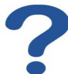
OFTTE STILTE SPØRSMÅL